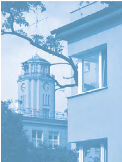
„Krzywik” z gmachem Urzędu Morskiego w tle

9. Budynek Urzędu Morskiego ul. Bernarda Chrzanowskiego 10 proj. arch. Adam Ballenstedt 1927, rozbudowa 1936