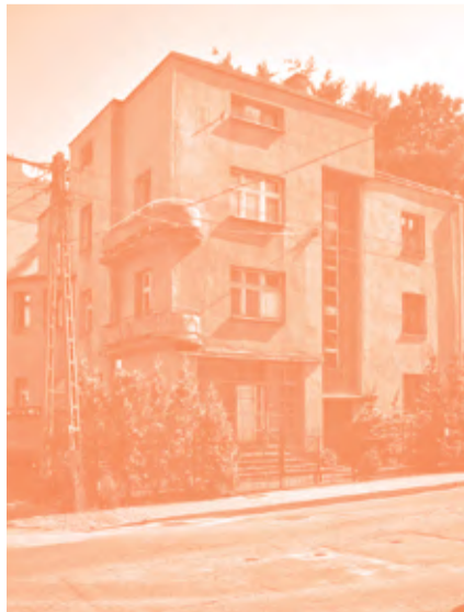
Dom mieszkalny, Słupecka 11

9. Willa Globiszów ul. Tatrzańska 16 proj. Z. Rutkowska-Globiszowa 1936-1937