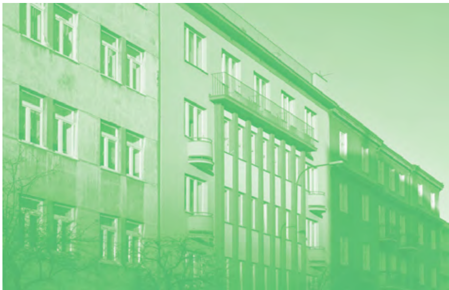
Kamienica Spółdzielni Mieszkanowo-Budowlanej „Pożytek 2”