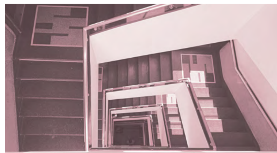
Kamienica Reicha i Birnbauma

ul. Abrahama 26 proj. pierwotny – arch. Stanisław Żwirski, proj. zamienny – arch. Jan Bochniak 1935