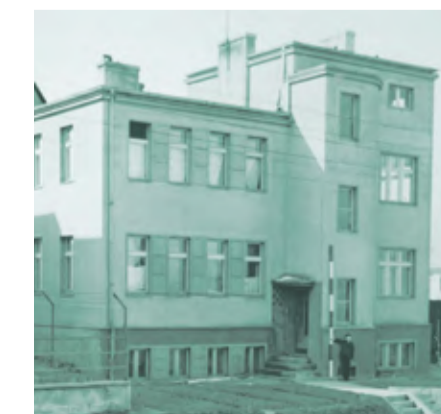
Dom mieszkalny przy ul. Krasickiego 36-38

ul. I Armii Wojska Polskiego 16 proj. St. Żwirski 1934-1935